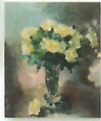
W OZDOBIENIACH (KORZYCZKI) Z GŁÓWNYMI (JA. 2011) W WYKONANIU: WYKONANIE W WYKONANIU: 2011