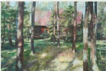
WIOSNA I LĘGKOŚĆ WIOSNA I LĘGKOŚĆ