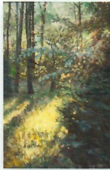
WIOSNA I LĘGKOŚĆ WIOSNA I LĘGKOŚĆ