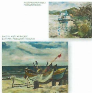
WIOSNA I LĘGKOŚĆ WIOSNA I LĘGKOŚĆ