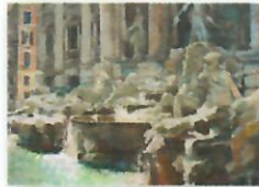
OD POKOJU DO POKOJU CIEPŁO I WIOSNA