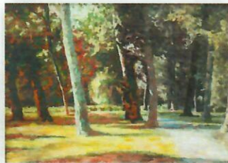
WIOSNA I LĘGKOŚĆ WIOSNA I LĘGKOŚĆ