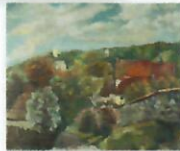
WIOSNA I LĘGKOŚĆ WIOSNA I LĘGKOŚĆ