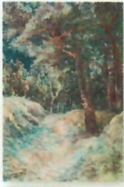
PODZIMNY KLIMAT WIOSNA I LĘGKOŚĆ