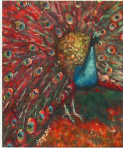
WIOSNA I LĘGKOŚĆ WIOSNA I LĘGKOŚĆ