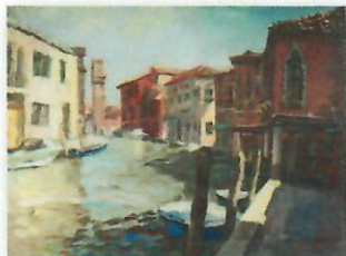
WIOSNA I LĘGKOŚĆ WIOSNA I LĘGKOŚĆ